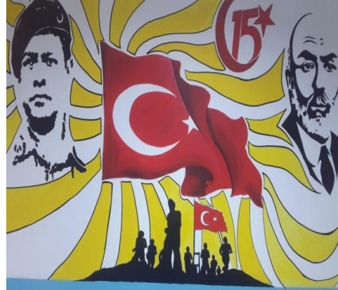
15 TEMMUZ KÖŞEMİZ